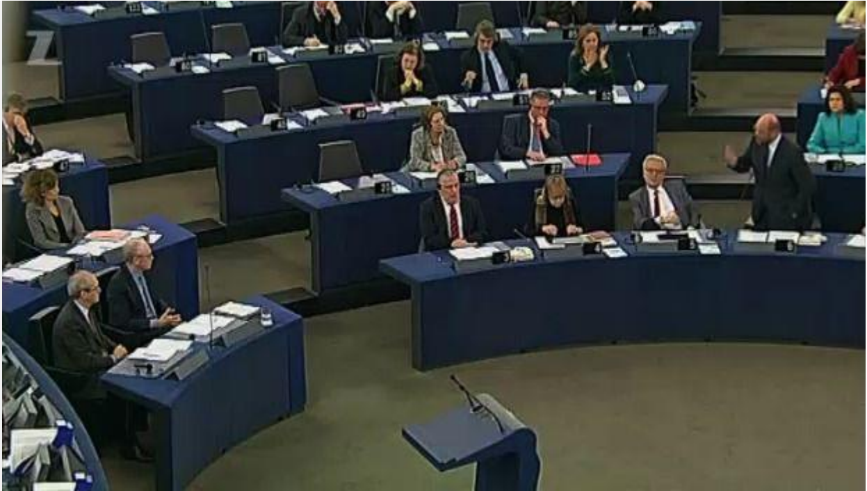
Vuurwerk in Europees Parlement

Een politieke partij die in de oppositie belandt kan in een hoekje zitten mokken en gefrustreerd de schuld op de anderen steken, op omstandigheden. Hoewel dit een zéér verspreide (klein)menselijke tendens is, is het toch niet erg volwassen en vruchtbaar, want dan plaatst men het beslissingscentrum buiten zichzelf, alsof men enkel een speelbal is van alle andere factoren. Het vraagt moed om naar binnen te kijken en zich af te vragen: Wat hebben wij fout gedaan? Wat moet intern veranderen? Tijdens een regeerperiode is men te hard bezig met regeren, waardoor er geen tijd is voor diepgaand zelfonderzoek: zolang je auto aan het rijden is, kan je er niet aan sleutelen.